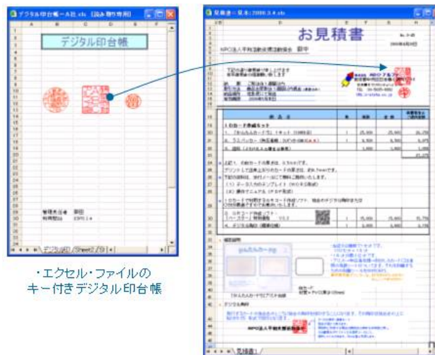
*エクセル・ファイルのキー付きデジタル印台帳